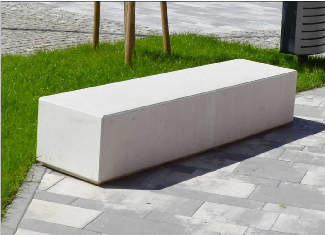
LEDGE 3 – ilustrační foto